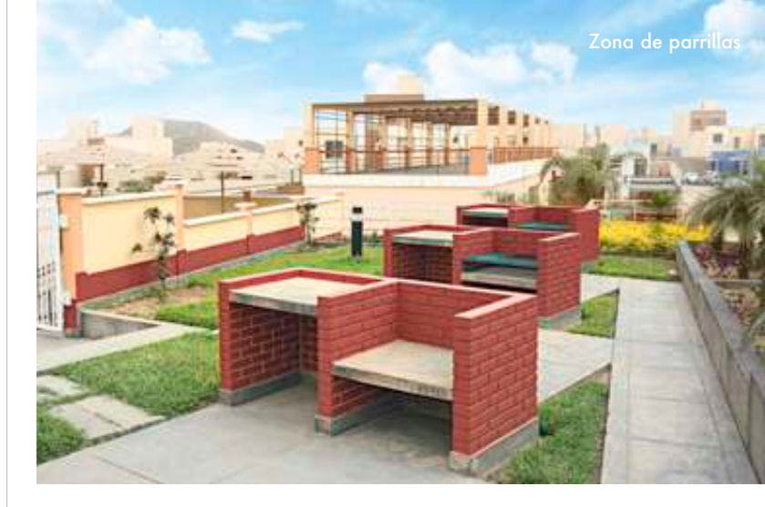
Zona de parrillas