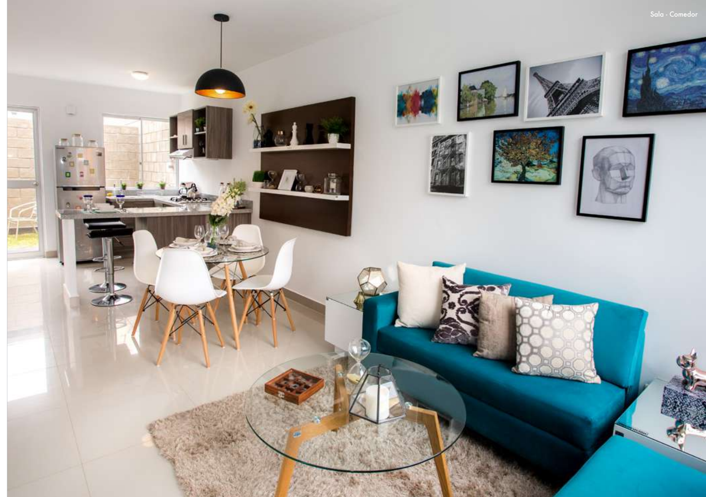
Sala - Comedor