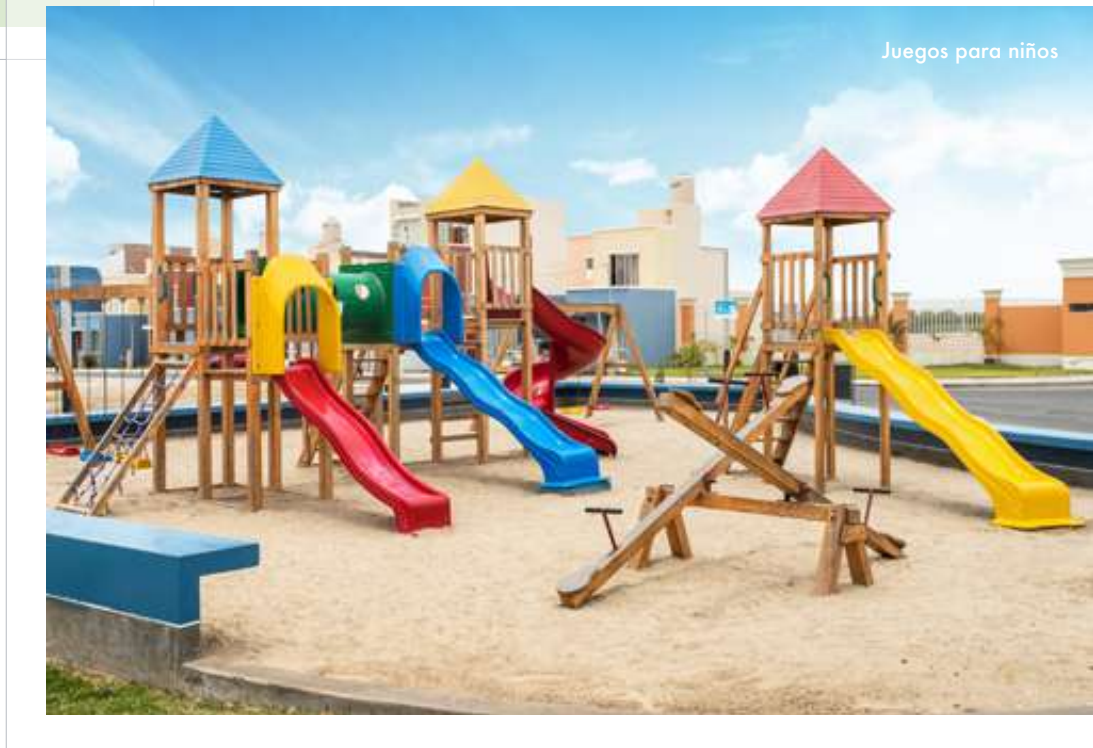
Juegos para niños